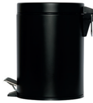
SO-6005-MBLA Papera de pedal 20,3 cm Ø x 28,4 cm alto 4 26,09 €