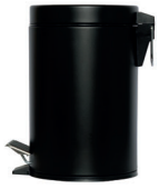
SO-6003-MBLA Papera de pedal 16,7 cm Ø x 27 cm alto 6 19,33 €

Elegante alternativa a las papeleras de acero inoxidable. Disponibles en 3 capacidades: 3, 5 y 30 litros. Están equipadas con un revestimiento extraíble para mantener las papeleras limpias y facilitar la eliminación higiénica del contenido. El mecanismo del pedal es 100% metálico.