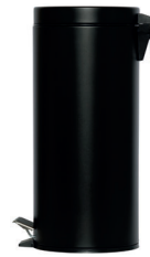
SO-6030-MBLA Papera de pedal 29,2 cm Ø x 64 cm alto 1 94,63 €